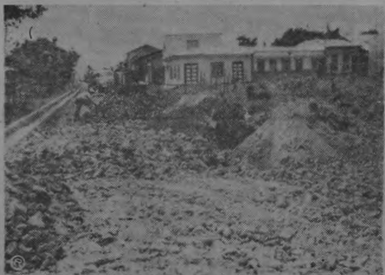
Activamente se está trabajando en Barrio Juárez, en la construcción de pistas y nuevas casas.