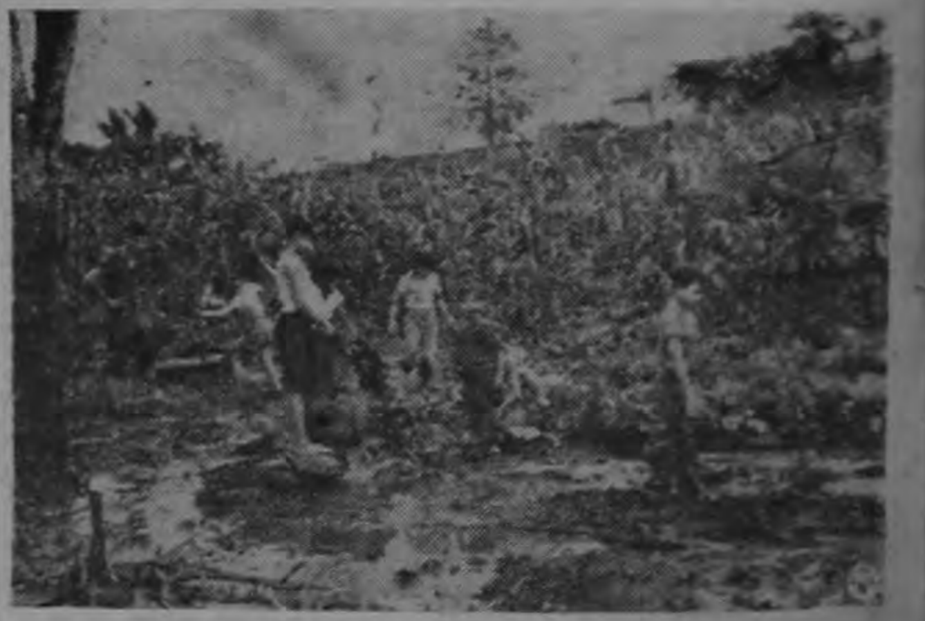
Los niños del Dormitorio Soldati esforzándose en reparar los daños causados por el aniego.