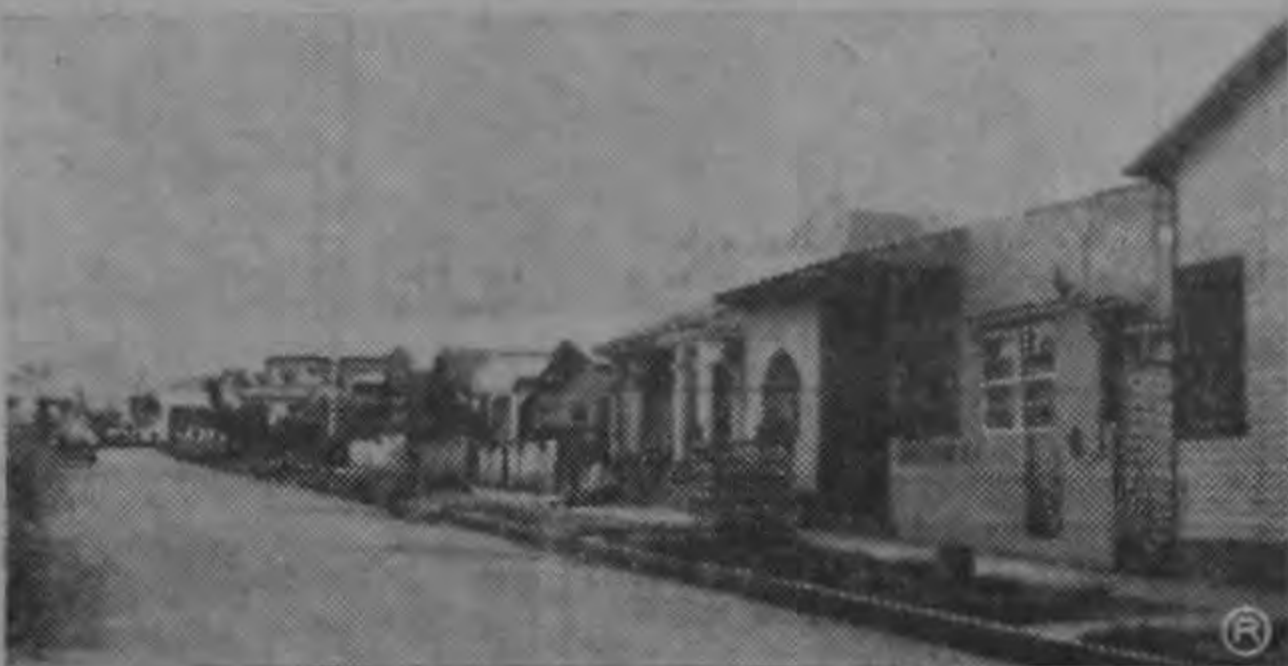
Magnífica perspectiva urbana de una de las calles de Barrio Juárez.