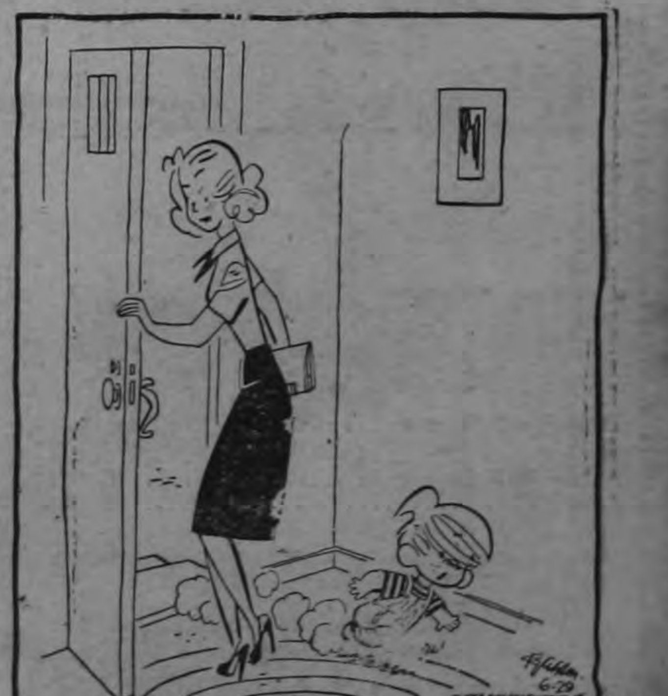
—¡Un momento, mami! ¡No puedo ir a la escuela sin llevar mi tirapiédras!...